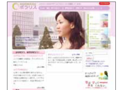
10代のためのSOSサイト 運営

2009年、国連の女性と子どもの人身売買に関する特別報告者であるジョイ・ヌゴジ・エゼイロ氏が任期中、公式訪問先として日本を指名しました。調査の結果、日本の対策を評価しつつも、被害者の認知のためのプロセスの不備、現場の警察職員の研修や被害者の人権に配慮した支援の必要性などを指摘した勧告書が国連に提出されました。被害者と接してきた当団体としては、日本における人身売買に関する政策には、今後さらなる改定が必要であると考えています。